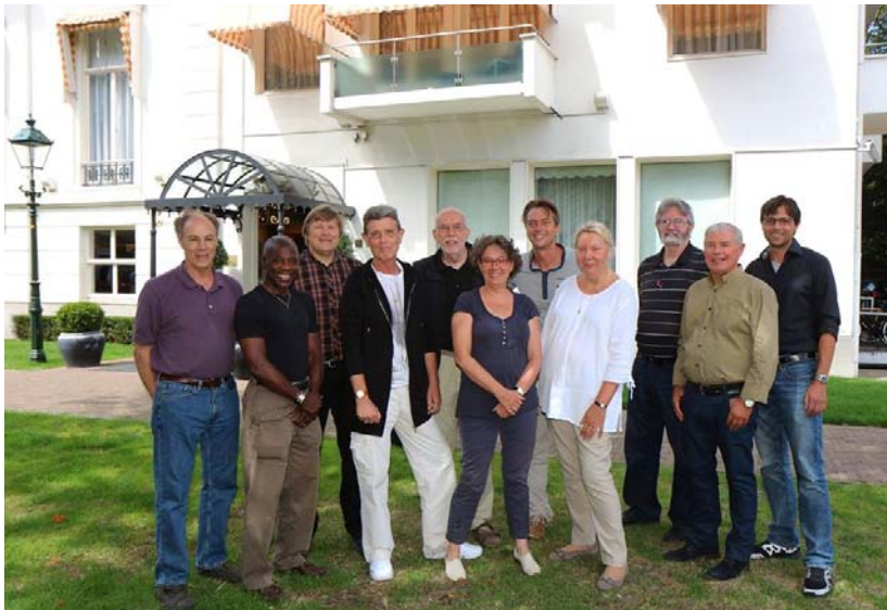
ITC Board of Directors 2015