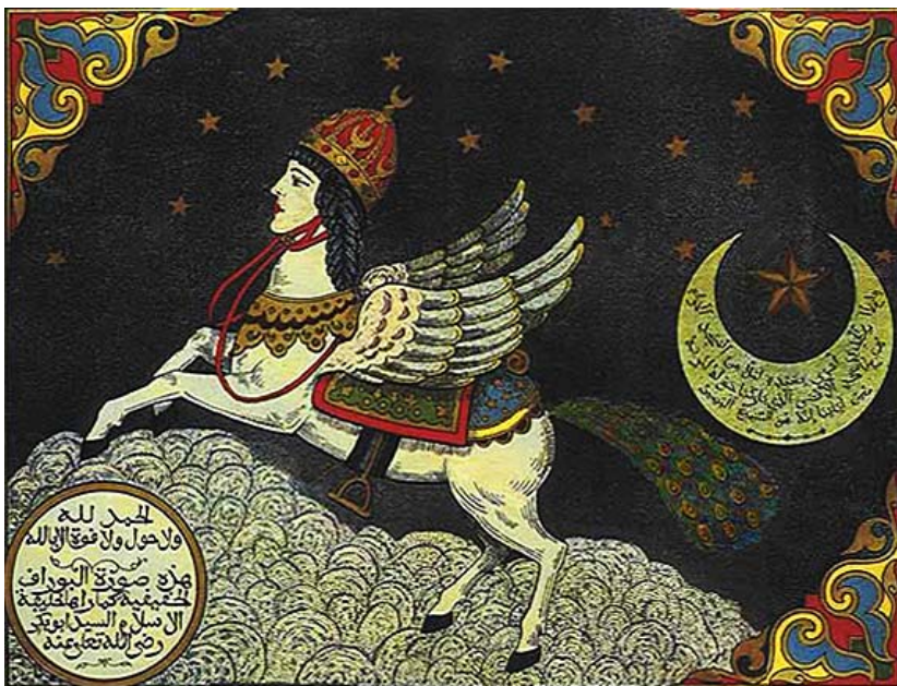
Abbildung: Buraq , das mythische Ross, auf dem Mohammed seine Nachtreise zu den sieben Himmeln machte. (Illustration im Mogulreich hergestellt, 17. Jahrhundert.) (13)