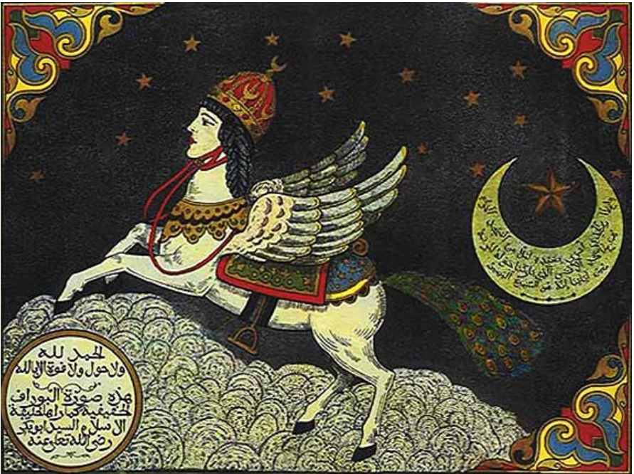
Abbildung: Buraq , das mythische Ross, auf dem Mohammed seine Nachtreise zu den sieben Himmeln machte. (Illustration im Mogulreich hergestellt, 17. Jahrhundert.) (13)

Wie erwähnt, wurde die Lehre der Emanation nachdrücklich durch Plotinus gelehrt. Das EINE, das Göttliche, sickert mittels eines Prozesses der Emanation, nur kurz beschrieben, in die äußere Welt.